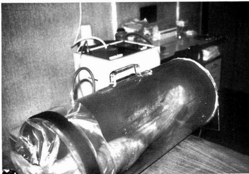
Fig. 5 - Cilindro de vacío para el tratamiento tópico con Ozono de úlceras de las piernas.

En todos los pacientes, excepto uno (paciente de 70 años con úlceras en ambas extremidades inferiores de más de 2 años de evolución y de diámetro superior a los 14 cm), se consiguió una curación «ad integrum» de la lesión. La mayoría de los pacientes mostraron una buena «compliance» al tratamiento. El número