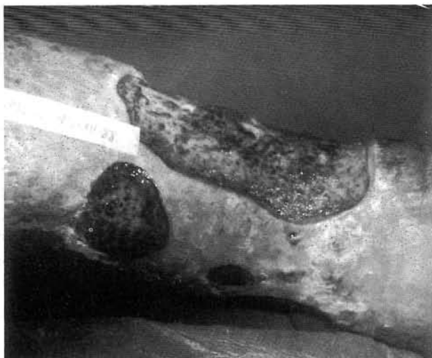
Fig. 1 - D.M.S. 74 a. Múltiples lesiones ulcerosas aparecidas hace siete meses en región antero-lateral de la pierna izquierda. Se inicia ozonoterapia tópica.